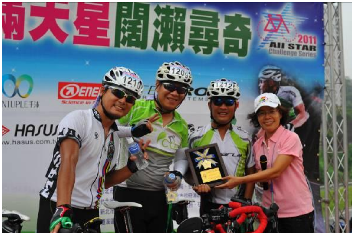
最佳團隊精神挑戰獎-湖口慢慢騎車隊