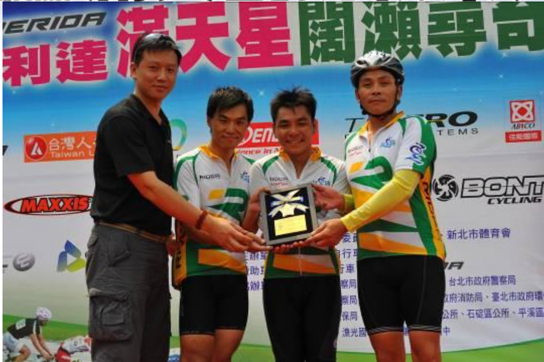
最佳團隊獎-探足跡車隊