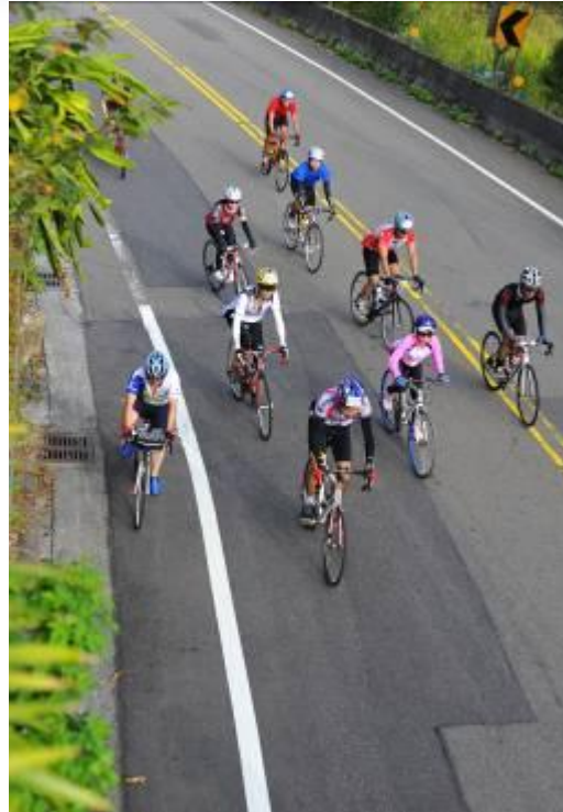
參加者奮力騎上坡