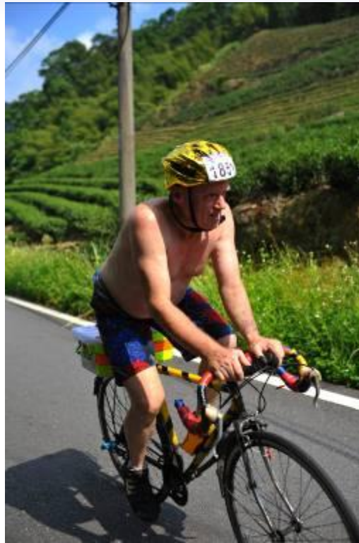
穿著最天然的『皮草』，暢行在坪林茶鄉