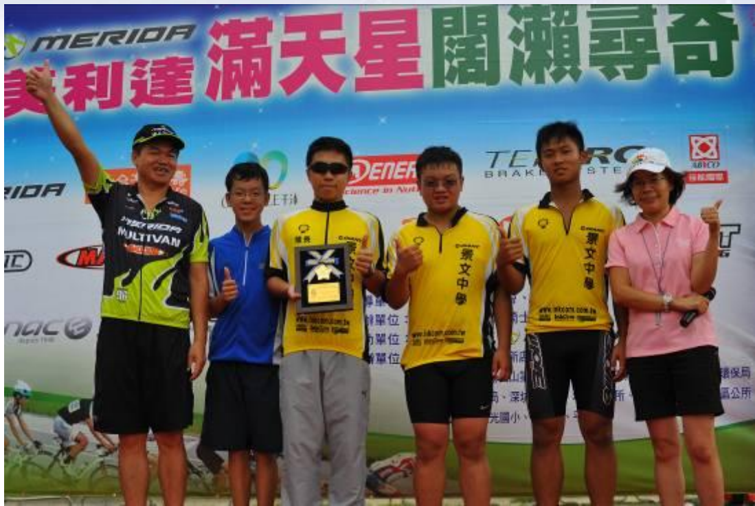
最佳團隊精神獎-景文中學自行車隊