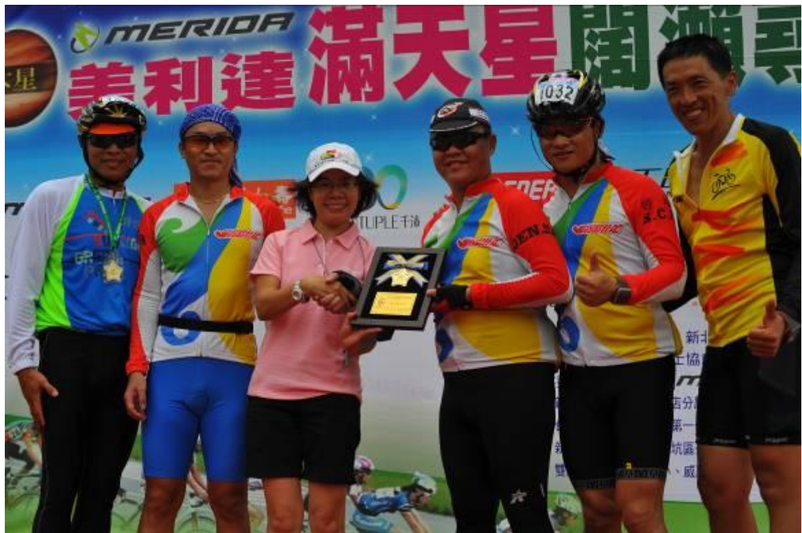
最佳團隊獎-粉鳥佳足車隊