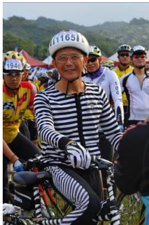
全身加自行車的黑白搭配，『斑馬哥』非他莫屬