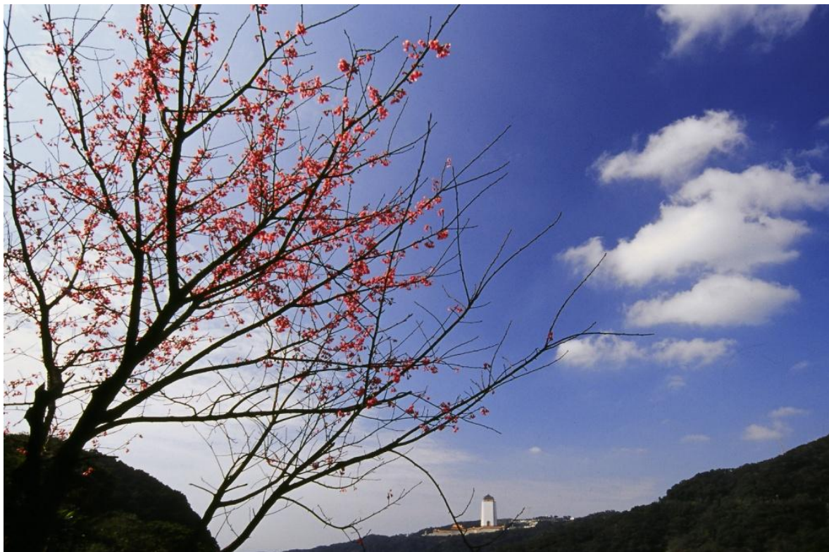
三芝櫻木花道