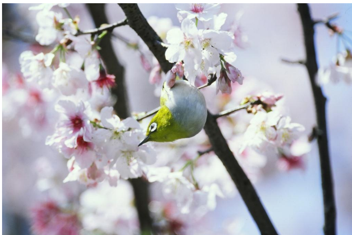
三芝櫻木花道