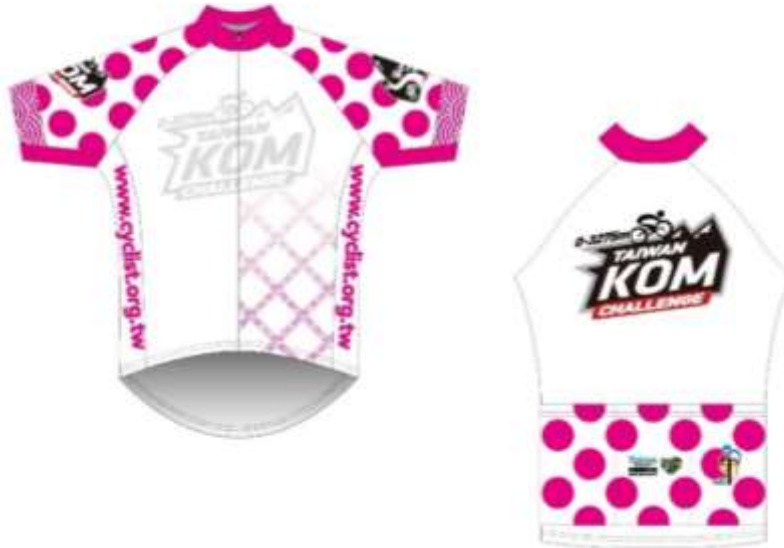
車衣尺寸丈量方式(平放)